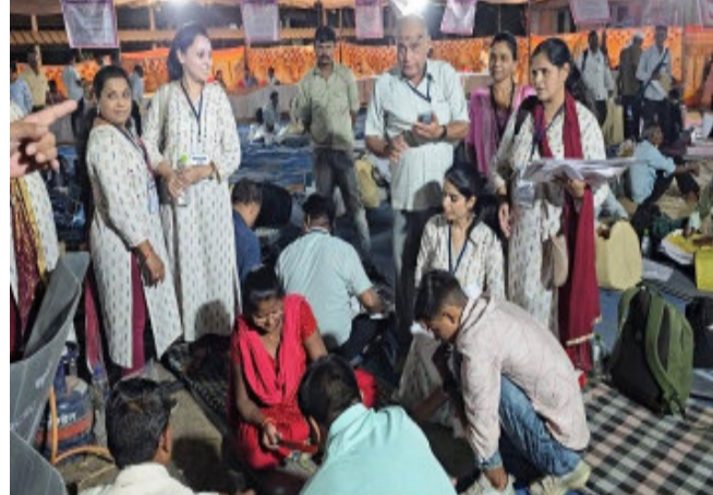
દાહોદ, જિલ્લામાં લોકસભાની ચૂંટણી શાંતિપૂર્ણ માહોલમાં સંપન્ન થઈ ગઈ છે. ત્યારે ગતરોજ રાત્રીના આઠ વાગ્યા બાદ ચૂંટણી અધિકારીના કર્મચારીઓ દ્વારા ઈવીએમ મશીનની રિસીવીંગની કામગીરીમાં જોતરાયેલા કર્મચારીઓ દ્વારા જિલ્લાના મતદાન મથકોથી ઈવીએમ મશીનો સીલ કરી સ્ટ્રોગ રૂમમાં ચુસ્ત પોલીસ બંદોબસ્ત સાથે લાવવામાં આવ્યાં હતાં. દાહોદની નવજીવન આર્ટસ કોમર્સ કોલેજ ખાતે રસાડોની સાથે ઈવીએમ મશીનો સીલ કરવામાં આવી રહ્યાં છે. જિલ્લામાં ૧૮૦૦થી વધુ ઈવીએમ મશીનો સ્ટ્રોગ રૂમમાં મુકવામાં આવ્યાં હતાં.